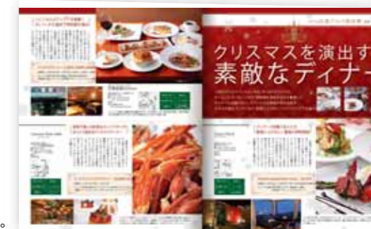
■ 忘年会向けグルメ企画

編集部でテーマを設けた展開です。 同業種や同ジャンルの店舗を集めることで、 読者の興味を喚起して、 より高い広告効果が期待できます。 純広告より低コストでPRできるのも魅力です。