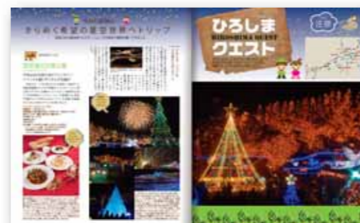
■ おでかけ連載「ひろしまクエスト」タイアップ例