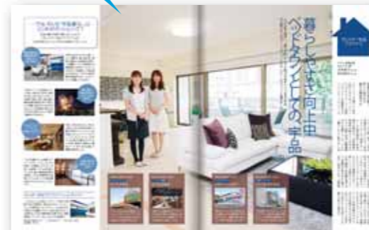
■ 街特集「新しく懐かしい街・宇品」タイアップ例

メイン特集やレギュラーコンテンツに、テーマや誌面テイストを合わせて展開する広告です。 編集記事と同化することにより、閲読率を高め、行動につなげることができます。