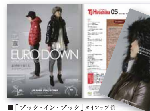
■ 「ブック・イン・ブック」タイアップ例