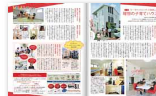
■ 子育てコーナー「ひろしまファミリー通信」タイアップ例